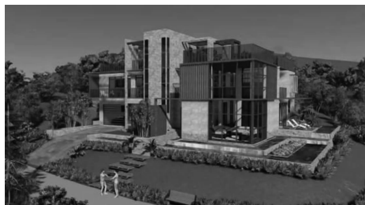
图4 新式三维建筑动画展示二

通过三维建筑动画进行学习的时候,学生可以自行选择需要观看的场景,对建筑及其周边的环境进行观察,既可从远景中一览建筑的外观信息以及建筑与周边环境的关系,也可从近景乃至特写镜头中观察到建筑的内部和细节。在观摩学习过程中,学生针对自己的具体情况进行有选择的学习,关注自己感兴趣的地方或者是想要细致研究的点,学习自主性得到提高;学生也可进行分组讨论,交流各自的想法,集思广益,让思维的火花迸发,学习主动性也随之增加。自主协作学习环境的构建,让学生能获得更宽阔的解决思路,更透彻的问题分析能力,更灵活多样的方法。