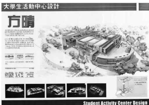
图1 传统平面作业图纸一

在传统建筑学教育中,二维图像的应用一直占据主导地位,课堂上教师讲课课件中的图片、课后学生的设计作业等均以图纸的形式呈现。平面化的教学模式具有以下优点。