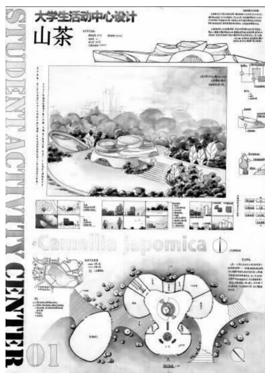
图2 传统平面作业图纸二

(1)平面的作业图纸 [2] 能够反映一个学生的真实手绘水平。手头表达功夫是一个学生的基本功与硬实力,用笔去思考是一个建筑师必须掌握的技能。另外,通过二维的图纸绘制,学生可以锻炼到用平面图纸表现立体空间的能力,也可通过特定的表现手法突出自己想要表达的重点内容,还能学习到相关的平面设计知识及排版知识。